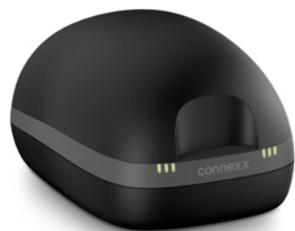
Mood Li-Ion G6 Hörsysteme