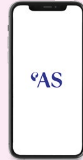
Größenvergleich mit iPhone X